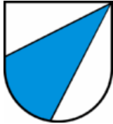
Beinwil am See