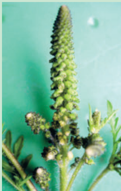
August und September ist die Hauptblütezeit, späte Pflanzen blühen bis im Oktober.