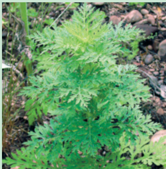
Im Juni bilden die Pflanzen Seitentriebe und wachsen in die Höhe.