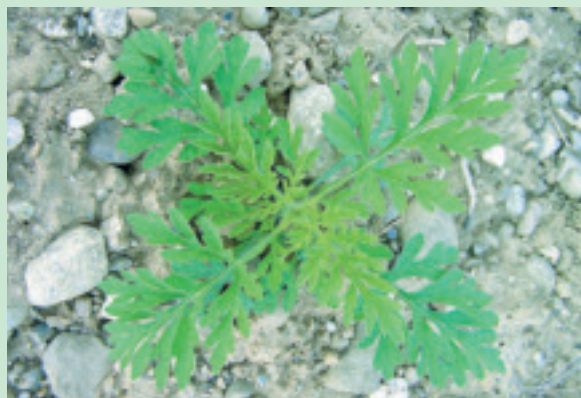
Ende Mai erreichen die frühesten Pflanzen eine Höhe von 10–15 cm.