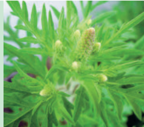
Im Juli werden Blütenstände sichtbar, die frühen Pflanzen beginnen zu blühen.