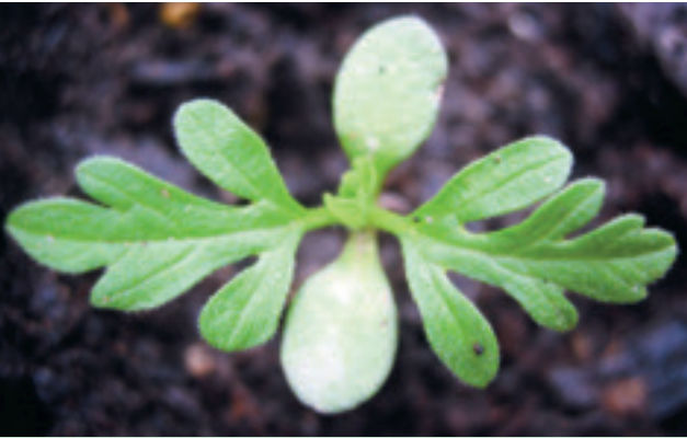
Keimpflanzen sind ab Mitte April bis Anfang September vorhanden. Die Hauptkeimzeit dauert von Mitte April bis Mitte Juni; nach einer Bodenbearbeitung laufen bis Anfang September neue Keimlinge auf.